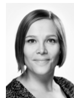
ASTRID KRAG Social- og ældreminister (S)

Regeringen har netop offentliggjort vores udspil, der skal sætte børnene først. Vi har truffet vores valg. Når det handler om omsorgssvigt af børn, vil vi altid stå på børnene side. Også selvom det i nogle tilfælde vil være på bekostning af forældrene, når de svigter deres børn.